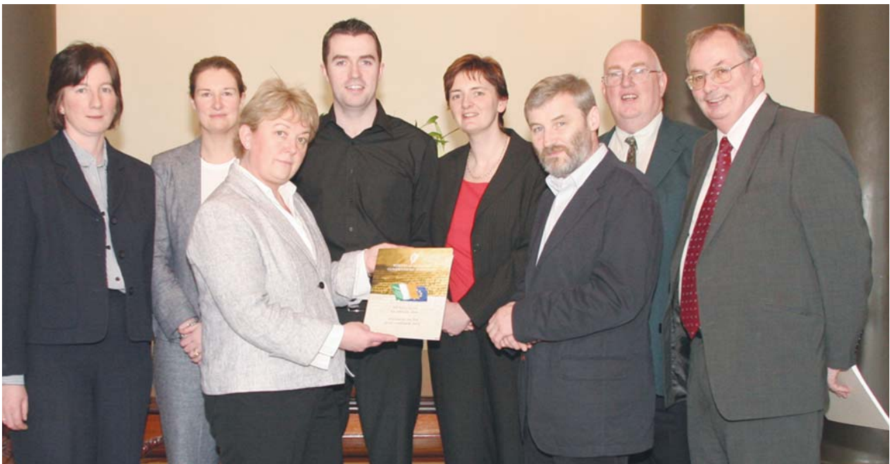
Grúpa Oibre na Gaeilge ag cruiniú i bPáirc na Darach, Ceatharlach